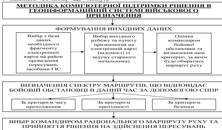
Рис. 3. Методика комп'ютерної підтримки рішення в ГІС військового призначення

В загальному вигляді методика комп'ютерної підтримки рішення в ГІС військового призначення наведена на рис. 3.