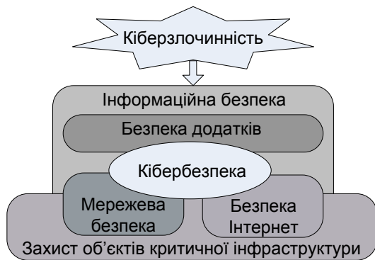
Рис. 1. Позиціонування кібербезпеки

інформаційна безпека – це заходи забезпечення конфіденційності, цілісності та доступності інформації для задоволення потреб користувачів;