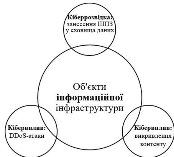
Рисунок 1 – Основні типи та об'єкти кібератак першого періоду воєнних дій у кіберпросторі (2005–2010 рр.)

Авторська візуалізація узагальнення основних типів кібератак та об'єктів кібервпливу першого періоду воєнних дій в кіберпросторі запропонована у вигляді діаграми Венна (рис. 1) [11; 15–16].