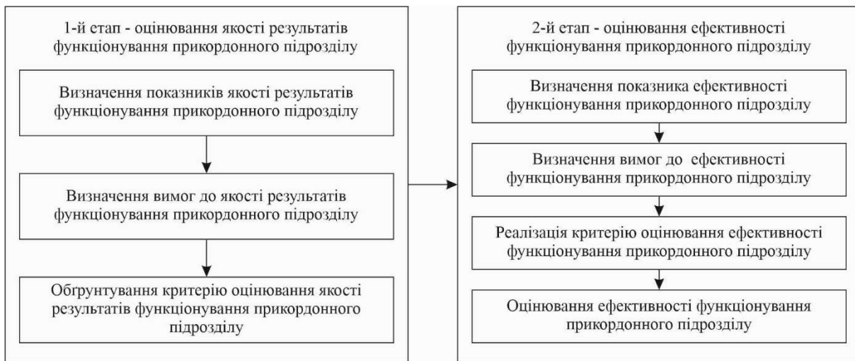
Рисунок 2 – Етапи оцінювання ефективності процесу функціонування прикордонного підрозділу [розроблено авторами]

Далі наведемо коротку характеристику цих етапів.