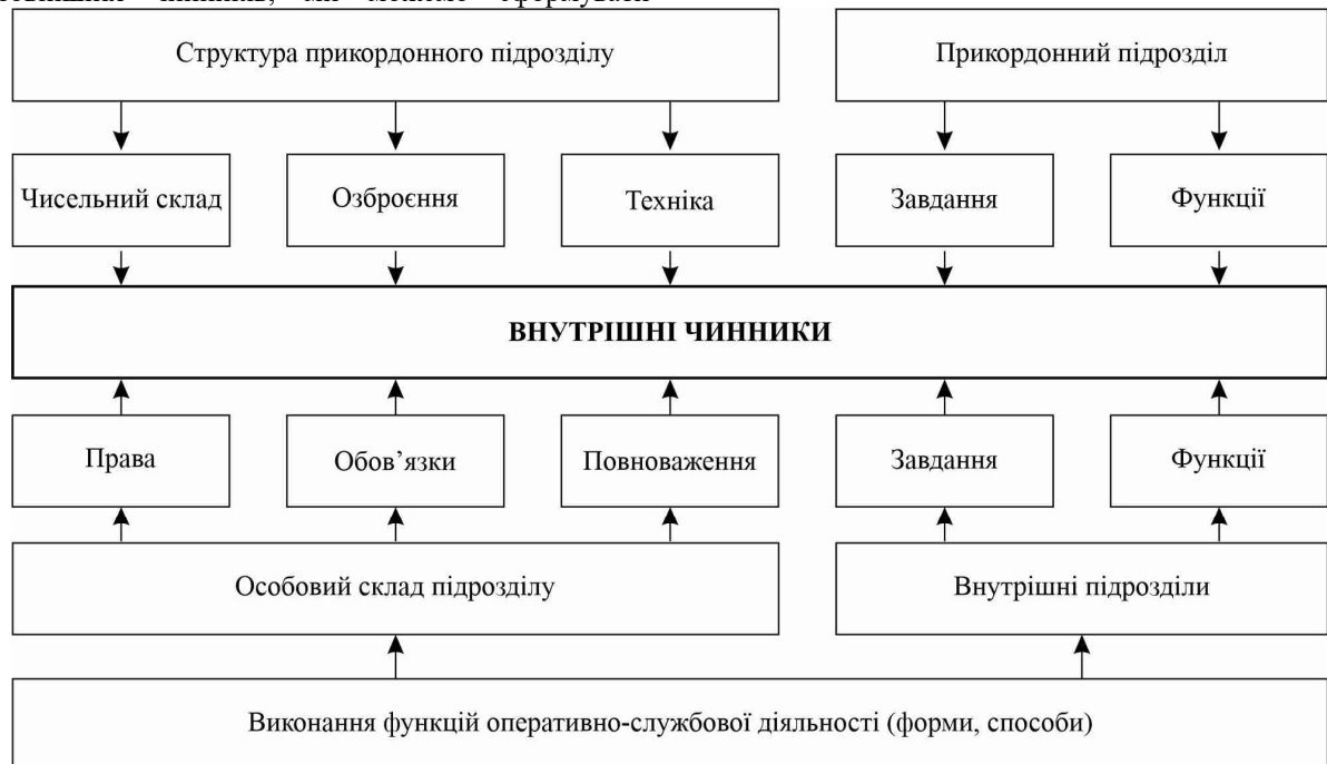
Рисунок 4 – Внутрішні чинники формування проекту організаційно-штатної структури новоствореного прикордонного підрозділу [розроблено авторами]

Вищенаведені чинники дають змогу сформувати середовище функціонування прикордонного підрозділу. Провівши аналіз зовнішніх чинників, ми можемо сформувати внутрішні чинники, що будуть впливати на формування проекту новоствореного прикордонного підрозділу (рис. 4).