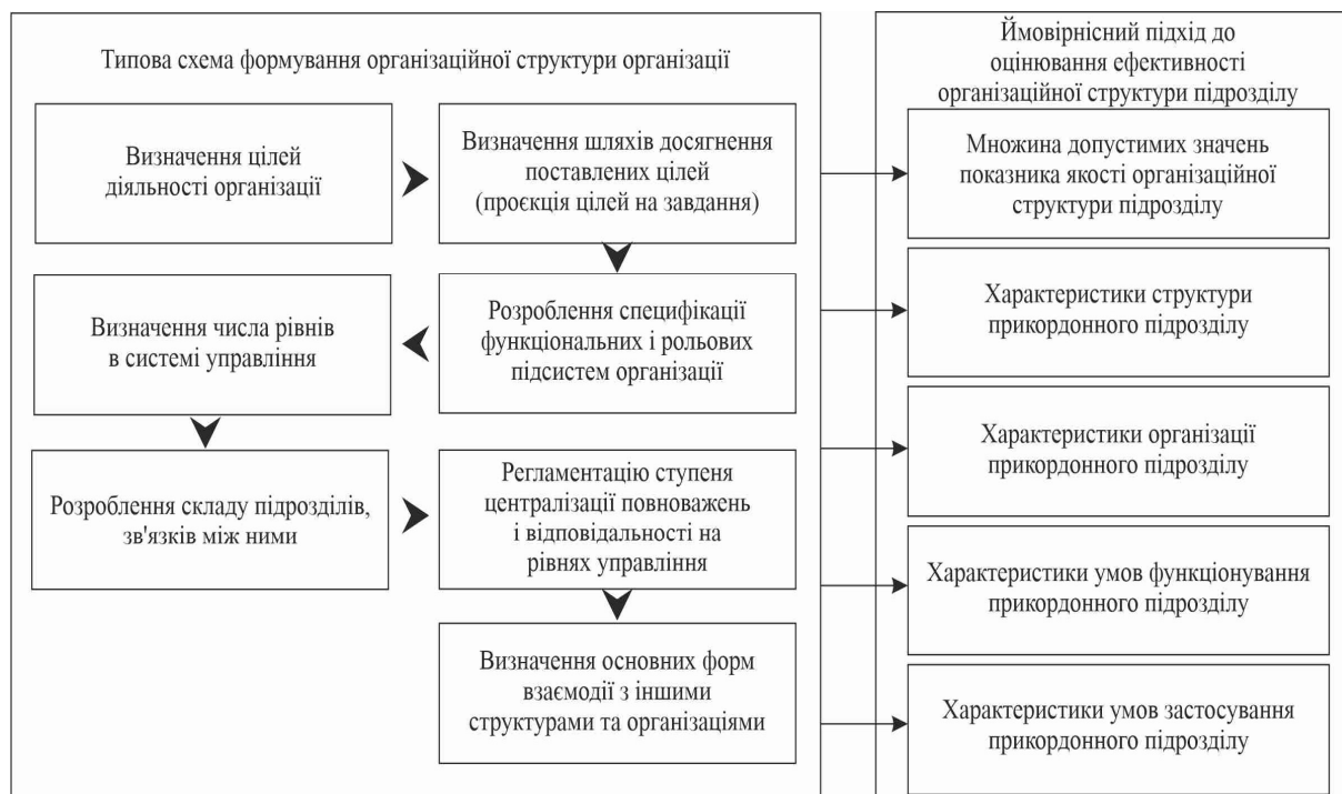
Рисунок 5 – Типова схема формування організаційної структури організації та параметрів ймовірнісної моделі

Отже, наведений ймовірнісно-детермінований підхід до процесу формування організаційної структури прикордонного підрозділу можна розглядати як ітераційний процес уточнення та пошуку найбільш раціональної організаційної структури організації. У цьому контексті пошук раціональної структури може бути достатньо довгим з причини відсутності у просторі вектору ефективних значень екстремумів або наявності багатьох локальних екстремумів, що може призвести до неможливості отримання конкретного рішення.