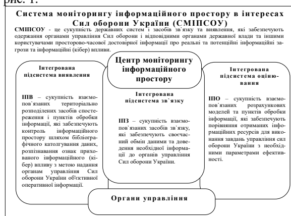
Рис. 1. Основні складові СМПСОУ

З точки зору критерію ефективності, а також опираючись на світовий та європейський досвід, синтез систем моніторингу інформаційного простору в інтересах Сил оборони України, які призначені для функціонування, як в мирний так і воєнний час, в Україні слід здійснювати на принципах подвійного призначення, тобто як військово-цивільних. І в першу чергу це стосується систем моніторингу кіберпростору, адже кіберпростір є одним із основних середовищ розповсюдження інформаційних (кібер) впливів. Основні складові зазначеної системи показано на рис. 1.