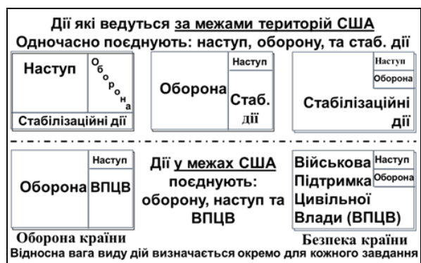
Рисунок 4. Концепція Рішучих дій (Decisive Action). Створено, перекладено та адаптовано авторами за [4].

стабілізаційних дій. Загальна ідея Рішучих дій представлена на рис. 4.