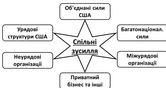
Рисунок 3. Партнери об'єднаних сил ЗС США у рамках Концепції “Спільні зусилля”. Створено та перекладено авторами на основі [21]

Об'єднані дії ЗС США та їх партнерів ведуться у рамках концепції Спільні зусилля (Unified Action) [12]. Спільні зусилля це синхронізація, координація та (або) інтеграція діяльності урядових і неурядових структур щодо дій збройних сил для досягнення єдності зусиль [19]. Зазначений підхід дозволяє командувачам об'єднаних сил ЗС США краще інтегрувати та використовувати спроможності партнерів по Спільним зусиллям (рис. 3).