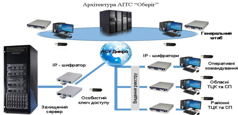
Рис. 1. Існуюча архітектура серверних рішень АІТС

Основа створення бази даних ЄДРПВР полягає у застосуванні принципу формування централізованої бази даних на віддаленому доступі, а функціонування її головного елементу в інтересах всієї системи управління в цілому в режимі миттєвого доступу – “тонкий клієнт”.