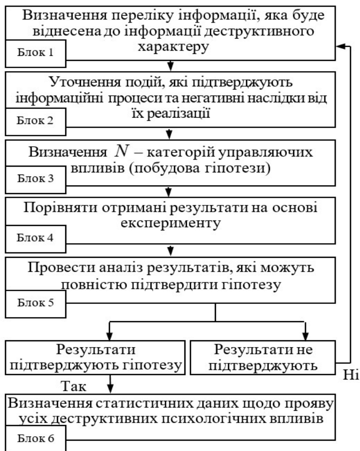
Рис. 1. Блок-схема методики психологічного впливу

З урахуванням цієї особливості, структурна блок-схема методики психологічного впливу на цільові аудиторії має вигляд, який наведений на рис. 1.