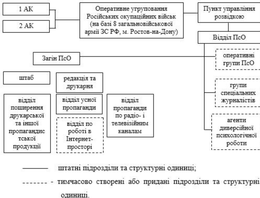
Рис 2. Орієнтовна структура підрозділів, яка здійснює заходи ПсО на Сході України.

Основними зразками озброєння загонів ПсО є: технічні засоби розсилання текстових повідомлень – комплекс радіоелектронної боротьби РБ-341В “Леер-3” із БПЛА “Орлан-10”;