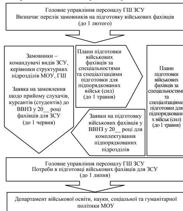
Рис. 1. Існуюча у ЗСУ методика визначення потреби у підготовці офіцерських кадрів.

Перелік спеціалізацій, за якими визначаються потреби на підготовку військових фахівців з вищою освітою та військово-облікових спеціальностей осіб офіцерського складу, що відповідають спеціальностям та спеціалізаціям підготовки військових фахівців, визначає Генеральний штаб ЗСУ [8, 12, 14].